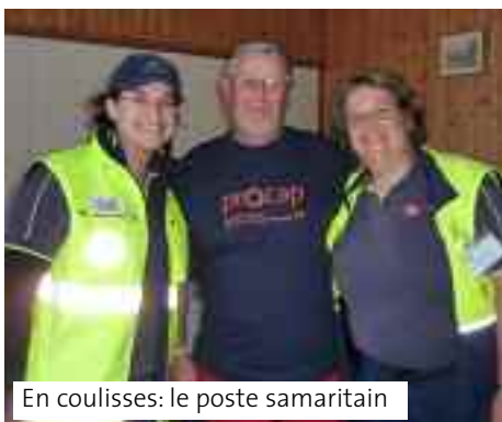
En coulisses: le poste samaritain