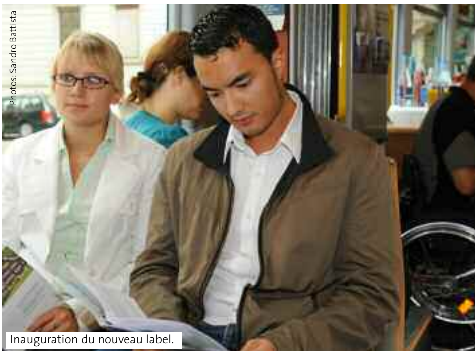
Inauguration du nouveau label.

trois ans puis il doit être renouvelé. La certification se déroule en trois étapes: après l'audit qui a lieu sur place intervient l'autorisation de la commission de certification dans laquelle les personnes concernées sont représentées, tout comme parmi les auditeurs. La décision définitive revient enfin au bureau de certification habilité Quality Service à Schaffhausen. Les données collectées sont enregistrées dans une base de données, et les voyageurs peuvent ainsi les consulter à tout moment.