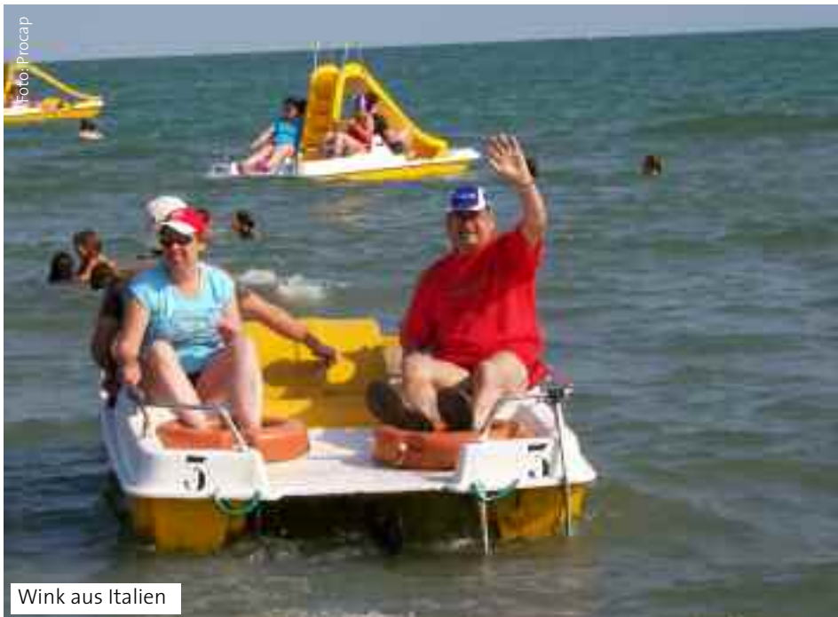
Wink aus Italien