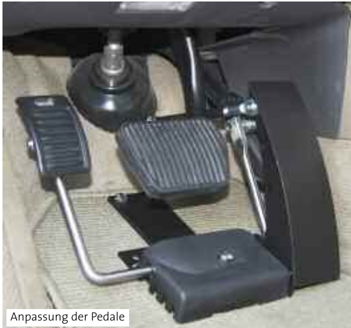
Anpassung der Pedale