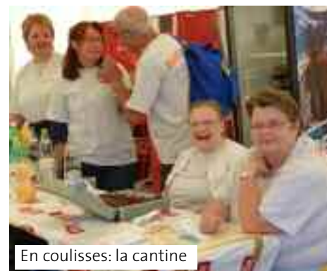
En coulisses: la cantine

de Procap. L'après-midi a permis au public de participer aux jeux de «sensibilisation» au cours desquels des paires mixtes (handicapé-valide) sont formées et où la confiance et la compréhension réciproques sont les critères de réussite.