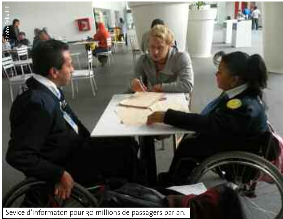
Service d'information pour 30 millions de passagers par an.

Une telle initiative à l'aéroport de Mexico-City, cela étonne. Dans les livres et les guides touristiques, le Mexique est décrit comme un pays plein de machos. Même le quotidien «El Universal», journal qui enregistre l'un des plus gros tirages du pays, a