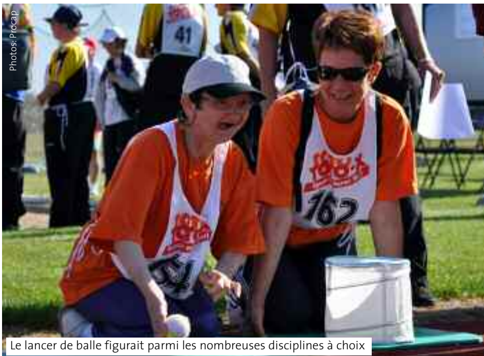
Le lancer de balle figurait parmi les nombreuses disciplines à choix